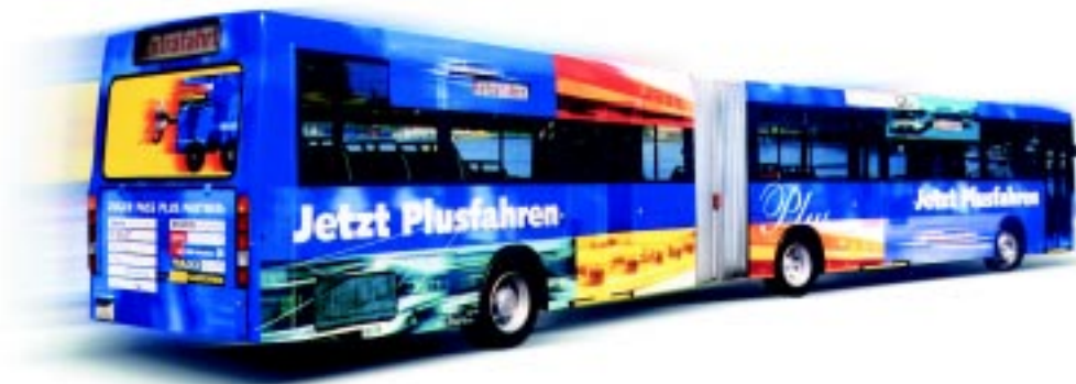
Mobilitätsmanagement bietet umweltfreundliche Alternativen und Information darüber.