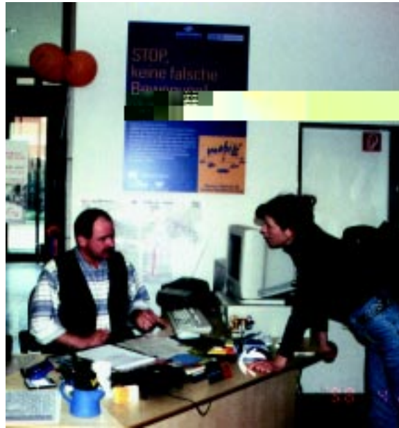
Vorher und nachher: Von einfacher Information über ausschließlich ein Verkehrsmittel zu einer integrierten, professionellen und persönlichen Beratung zur multi-modalen Verkehrsmittelwahl.