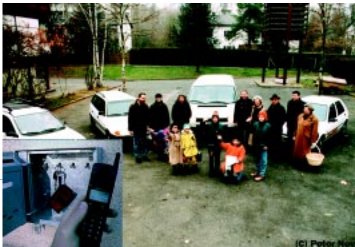
Car Sharing - die Vorzüge der Nutzung eines Autos ohne die Nachteile seines Besitzes.

Die Mobilitätszentrale "Via Libera" in Bologna wird von der Stadtverwaltung betrieben und bietet eine Reihe verschiedener Dienstleistungen an wie z. B. persönliche Fahrpläne für den Öffentlichen Verkehr, Informationen über Park&Ride oder Radverkehrseinrichtungen. Mehrere in den Büroräumen der Mobilitätszentrale vorhandene elektronische Informations-Terminals unterstützen die Dienstleistungen